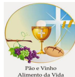
Pão e Vinho Alimento da Vida

Domingo, dia 20 de Maio – Missa das 12pm – Bilingue Sunday, May 20, at 12pm Bilingual